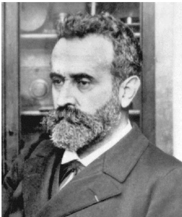
Альфонс Бертильон (1853-1914)